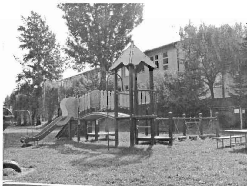
Rys. 2 Przyszkolny plac zabaw

Oprócz tego funkcjonujący we wsi Ludowo-Uczniowski Klub Sportowy „Burza” Rogi zarządza pełnowymiarowym, ogrodzonym stadionem, z trybuną na 800 widzów.