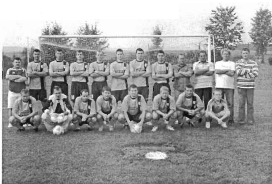
Rys. 5 LUKS Burza Rogi