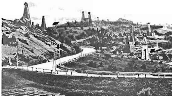
Kopalnie nafty w Rogach obok Dukli