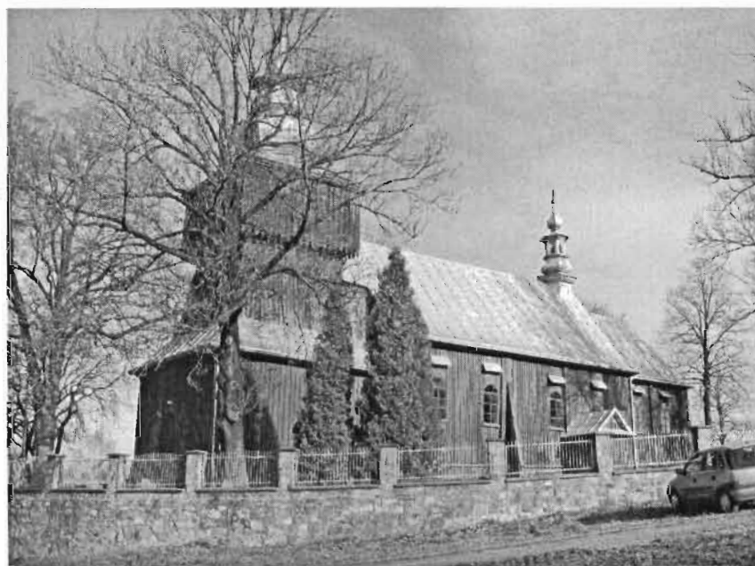
Rys. 3 Kościół pw. Św. Bartłomieja

Najważniejszym zabytkiem wsi Rogi jest stary drewniany kościół. Jego budowę rozpoczęto w 1600 r., zaś 3 lata później kościół został poświęcony. Rogowska świątynia od tamtego czasu za patrona ma św. Bartłomieja. Kościół przetrwał do dnia dzisiejszego w formie nieco zmienionej od pierwotnej, gdyż był kilkakrotnie przebudowywany. Na szczególną uwagę zwiedzających zasługuje późnobarokowy ołtarz główny, ambona w kształcie owocu granatu, chrzcielnica i stary, drewniany konfesjonał z malowidłami rokokowymi, pochodzącymi z 1756 roku. Wartość zabytkową posiada także krzyż ołtarzowy z XVIII wieku.