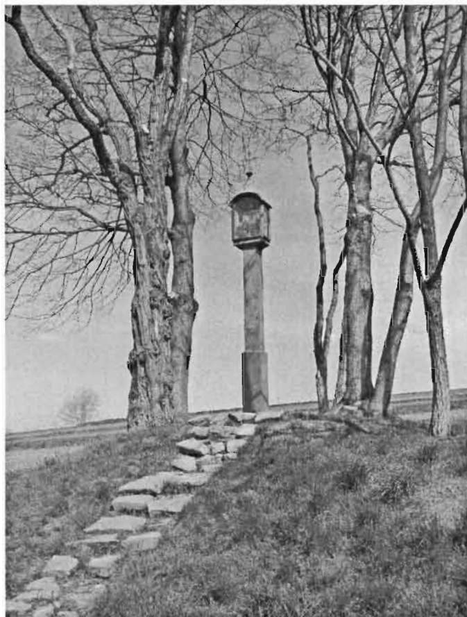
Rys. 1 Mogiła Konfederatów Barskich

6 kwietnia 1769 r. na polach rogowskich miała miejsce bitwa pomiędzy konfederatami barskimi a Moskalami. W czasie walk ranny został Kazimierz Pułaski, późniejszy bohater wojny o niepodległość Stanów Zjednoczonych Ameryki. Poległych w walce żołnierzy pochowano w dwóch zbiorowych mogiłach.