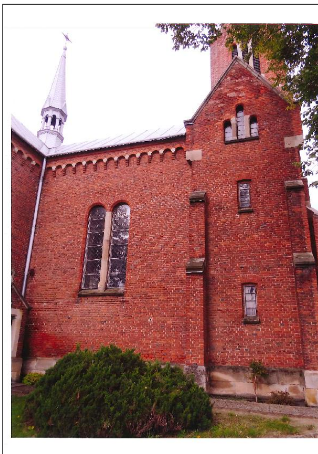
Kościół p.w. Nawiedzenia Najświętszej Maryi Panny w Miejscu Piastowym

W roku 2020 parafia p.w. Nawiedzenia Najświętszej Maryi Panny w Miejscu Piastowym otrzymała dotację celową na dofinansowanie do prac konserwatorskich przy zabytku wpisanym do rejestru zabytków znajdujących się na terenie Gminy Miejsce Piastowe. Zakres czynności prac obejmował: prace konserwatorskie elewacji ceglanej ścian kościoła parafialnego w Miejscu Piastowym oraz kamiennych detali architektonicznych – elewacja boczna południowa oraz zachodnia.