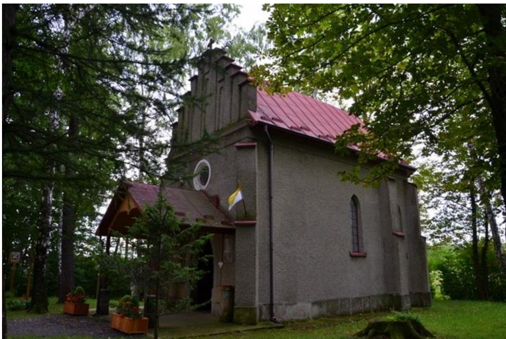
Zabytkowa Kaplica pod wezwaniem Św. Rozalii we Wrocance

W 2019 roku w ramach Podkarpackiego Programu Odnowy Wsi zagospodarowany został teren wokół Kaplicy pod wezwaniem Św. Rozalii we Wrocance. Zamontowano tablicę informacyjną dotyczącą zabytku.