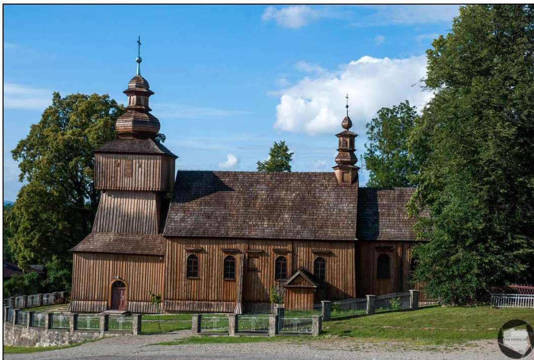
Zabytkowy kościół pod wezwaniem Św. Bartłomieja w Rogach

Wójt gminy sprawuje nadzór nad pomnikami przyrody i zabytkami znajdującymi się na terenie Gminy Miejsce Piastowe.