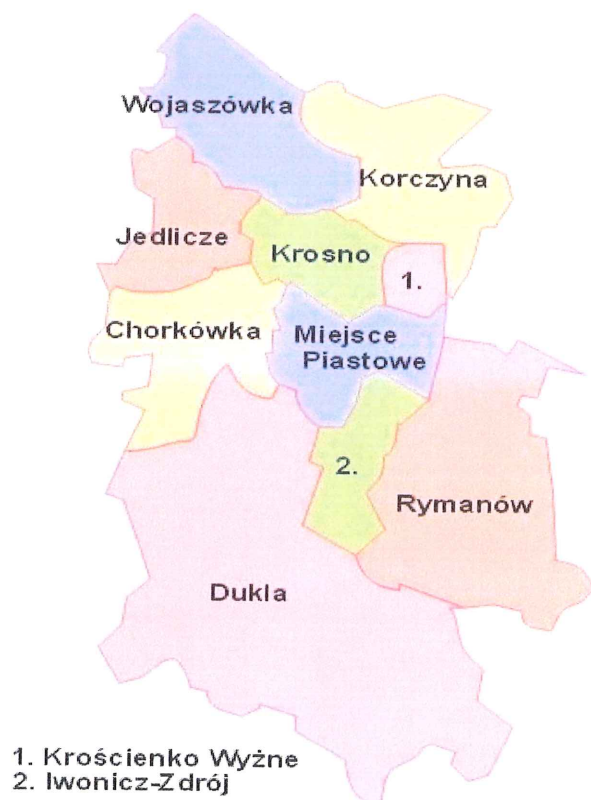
Rysunek 1. Gmina Miejsce Piastowe na tle powiatu krośnieńskiego

Gmina Miejsce Piastowe położona jest w województwie podkarpackim, w powiecie krośnieńskim. Oddalona jest od Krosna o około 8 km i od Rzeszowa o około 60 km, dlatego też pozostaje w obszarze bezpośrednich wpływów obu miast (społecznych, ekonomicznych, rekreacyjnych i infrastrukturalnych). W skład gminy wchodzi 9 sołectw, zaś terytorium gminy obejmuje obszar 51 km 2 .